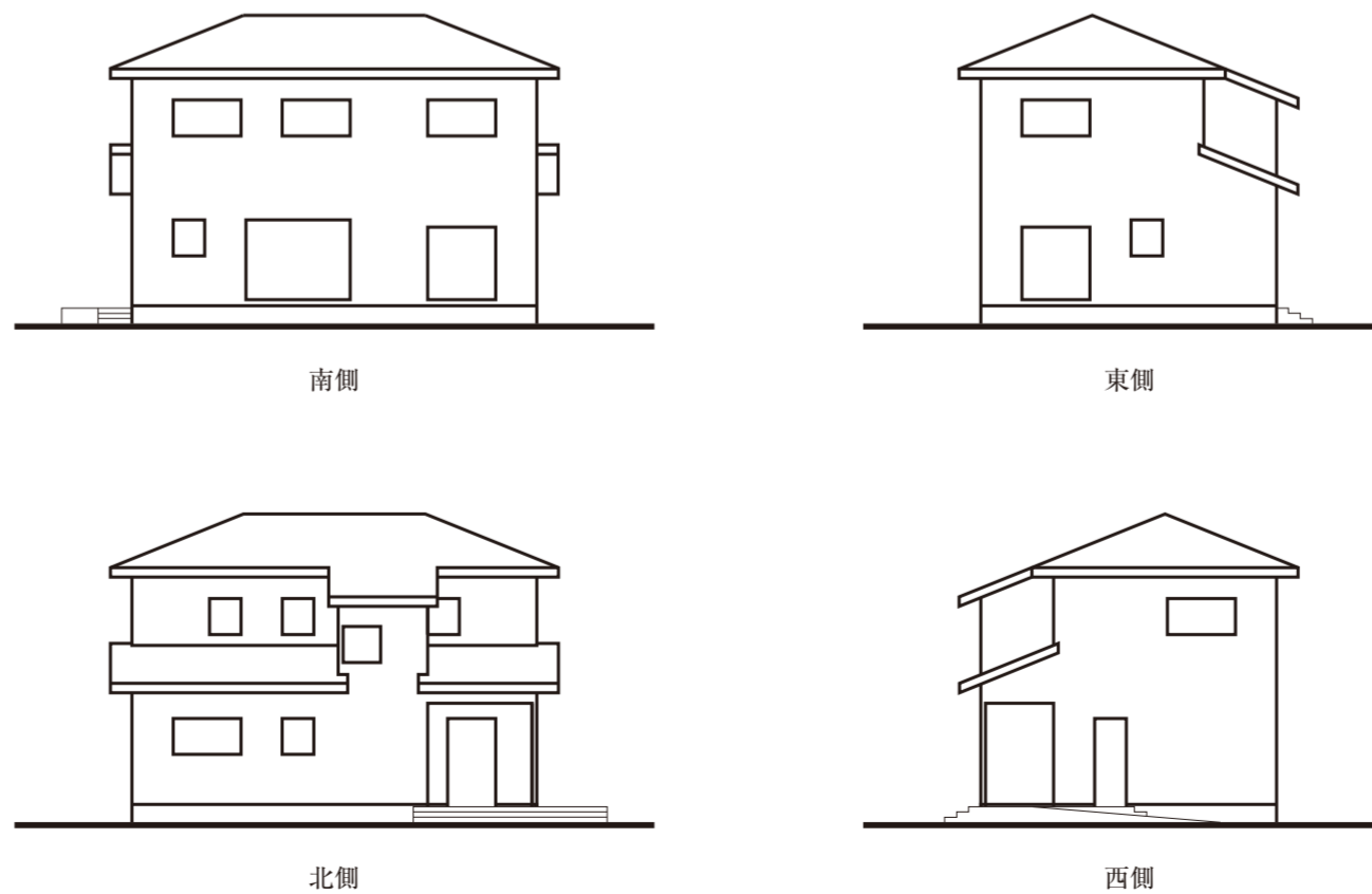
図-3 略立面図 (縮尺: 1/200)