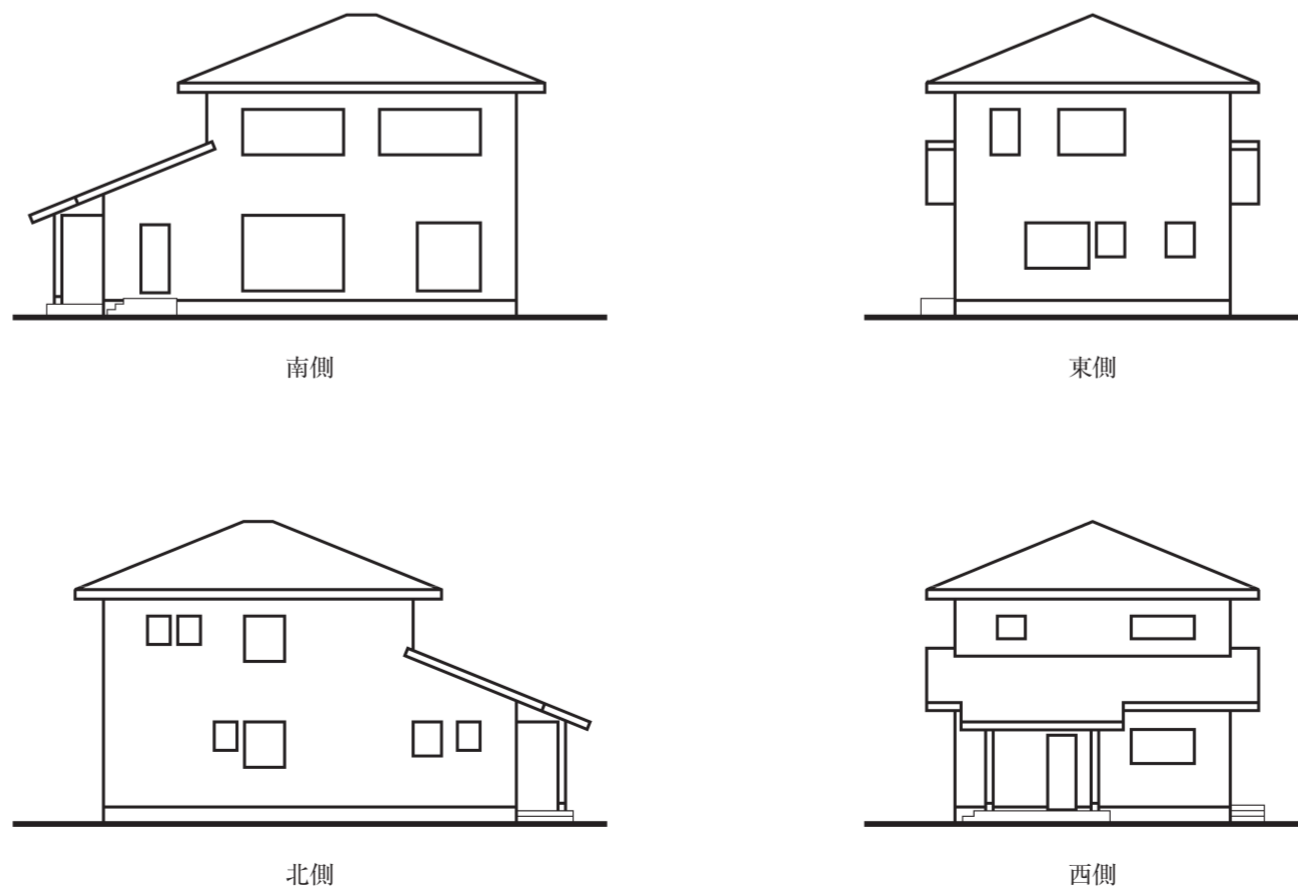
図-3 略立面図 (縮尺: 1/200)