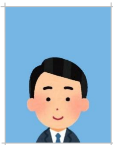
顔画像が小さく、 余白が多い