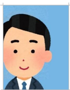
左右上下に寄っている