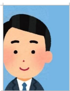
左右上下に寄っている