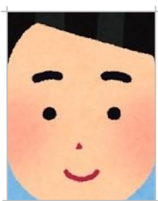
顔が寄りすぎている