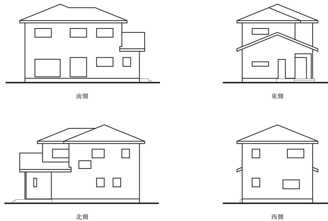
図-3 略立面図 (縮尺: 1/200)