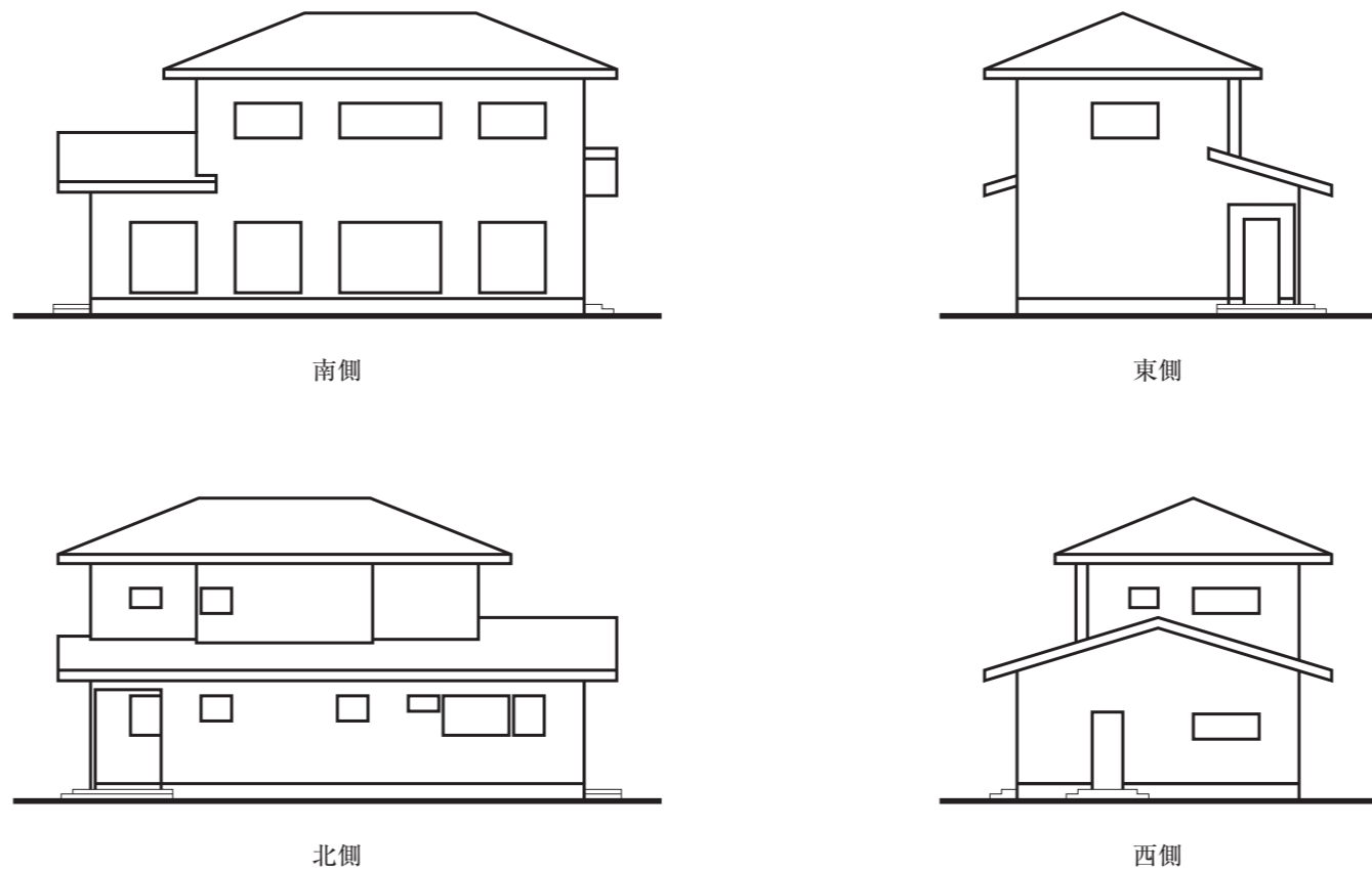
図-3 略立面図 (縮尺: 1/200)